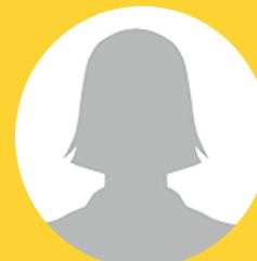
Véronique Le Moigne Réf. eufs jeudi